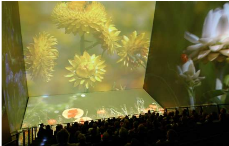
Le futur a-t-il un avenir? // 2004

Le Palais des images immerge complètement le spectateur dans l'image, grâce à son dispositifs d'écrans de 12 mètres de haut non seulement face au public, mais aussi sur sa gauche, sur sa droite, au sol et au plafond. Le tout dans une ambiance sonore véhiculée par 18 haut-parleurs. D'un mur à l'autre, les images, complémentaires, s'interpellent, se répondent et agissent entre elles comme un écho visuel.