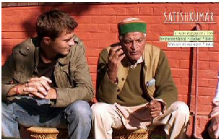
ENSEMBLE! // 2016