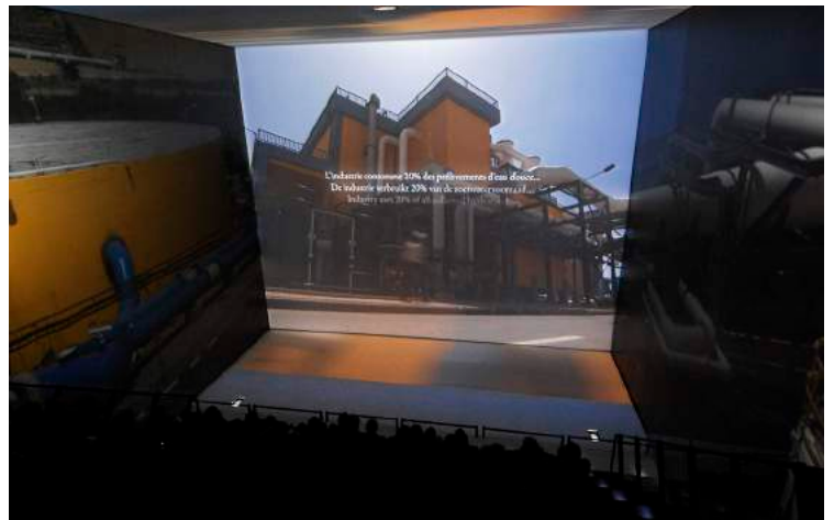
H 2 O! // 2007